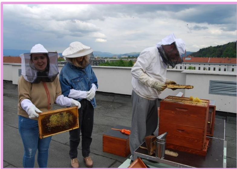
Zajtrk pridelan na strehi šole